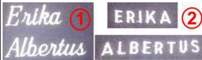
Abbildung: Jubiläumsdruck auf der Rückseite

Abbildung: Schriftarten für den Namen auf der linken Brust