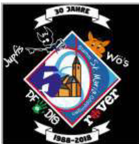
Abbildung: Jubiläumsaufnäher für die Kluft etc.

Im folgenden Bereich geht es um den Jubiläumsaufnäher für die Kluft etc. Dieser ist etwa 13 Zentimeter hoch und 12 Zentimeter breit. Das Ergebnis wird der Abbildung unten ähnlich sehen. Die Kosten für einen Aufnäher belaufen sich auf voraussichtlich auf ca. 5,00 € .